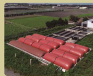
▲污染防治及廢水處理設施